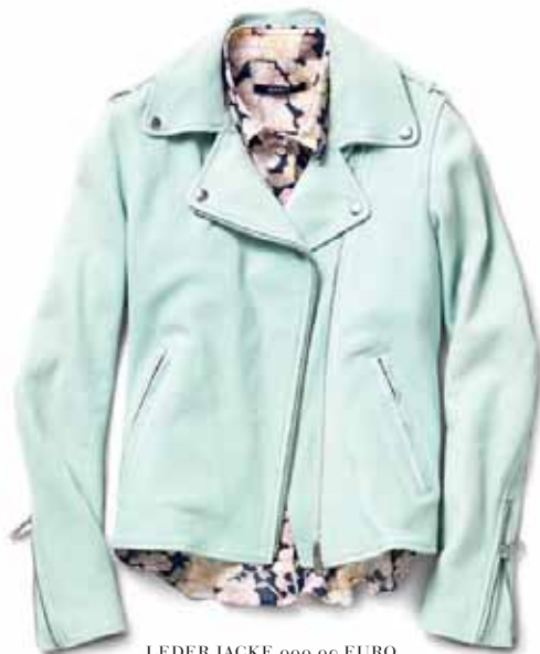
LEDER JACKE 999.90 EURO FLOWER BLUSE 139.90 EURO