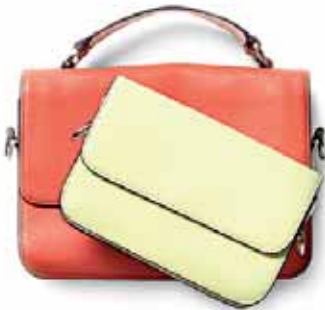
TASCHE 399.90 EURO TASCHE 329.90 EURO

MIT UNSEREN ERGÄNZENDEN ITEMS VEREDELN SIE UNSERE LOOKS UND GEBEN IHNEN DIESEN LÄSSIGEN TOUCH VON COOLNESS.