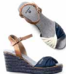
SCHUH SUSAN 89.90 EURO