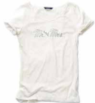
T-SHIRT 49.90 EURO