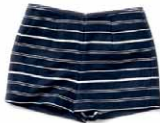
SHORT 149.90 EURO