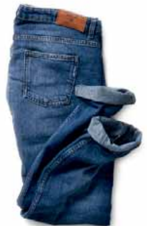
BOYFRIEND JEANS 159.90 EURO