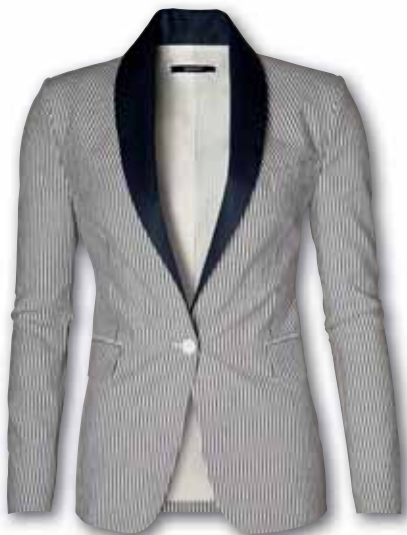
BLAZER 349.90 EURO