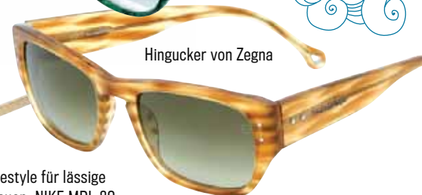
Hingucker von Zegna