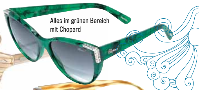
Alles im grünen Bereich mit Chopard