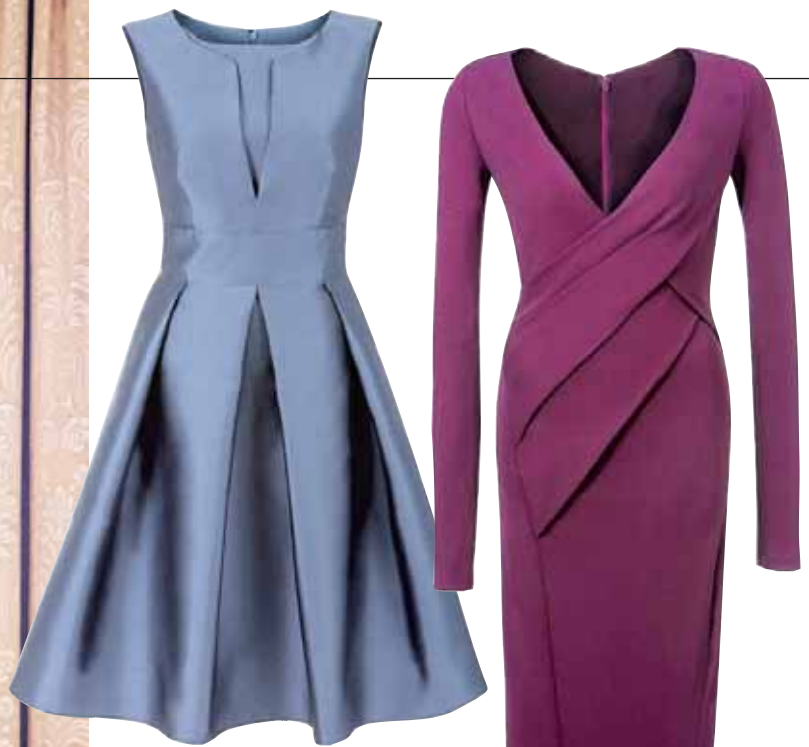
Glitzernde Abendrobe von Jenny Packham, metallisch glänzendes Seidenkleid in Platingrau von Armani Collezioni, elegantes, bordeauxfarbenes Jerseykleid von Donna Karan und die neue Designerabteilung