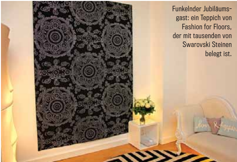
Funkelnder Jubiläumsgast: ein Teppich von Fashion for Floors, der mit tausenden von Swarovski Steinen belegt ist.