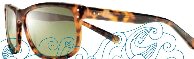
Lifestyle für lässige Frauen: NIKE MDL.80