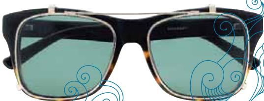
Inszenierung à la Kate Moss: Givenchy