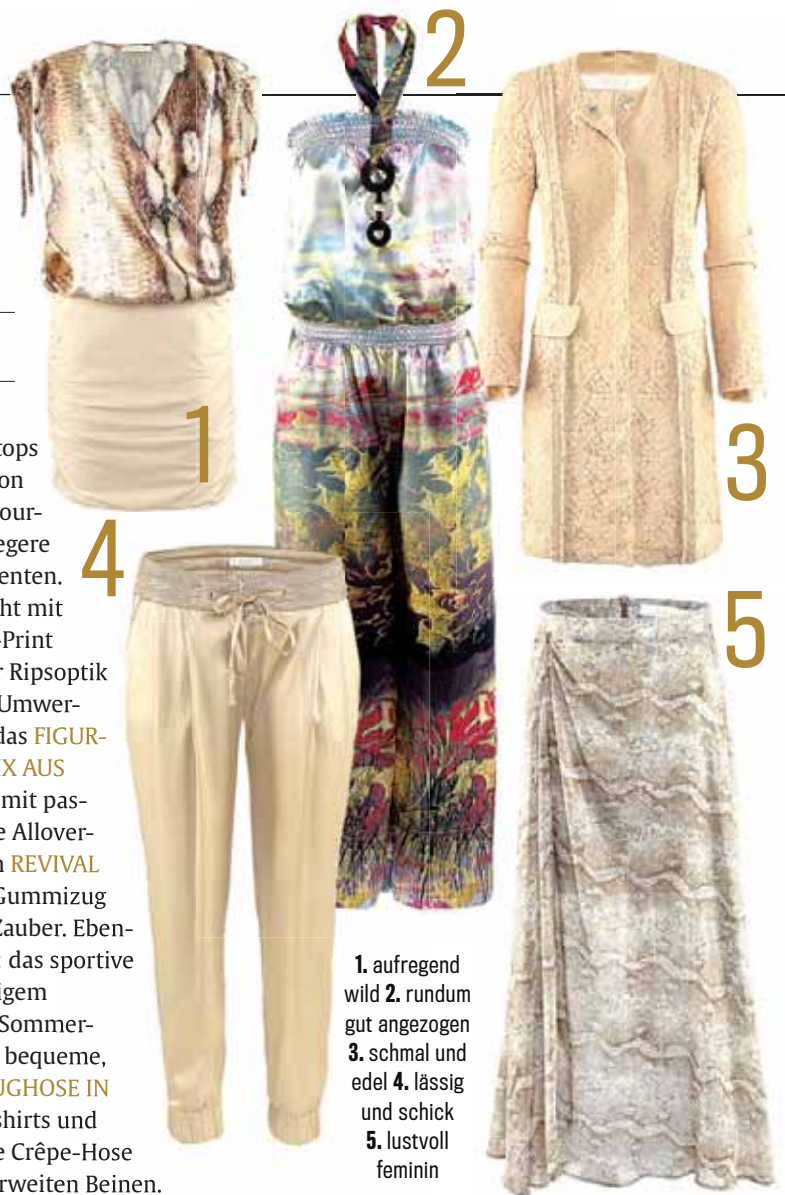
1. aufregend wild 2. rundum gut angezogen 3. schmal und edel 4. lässig und schick 5. lustvoll feminin

AIRFIELD Store München, Theatinerstraße 46 80333 München, www.airfield.cc