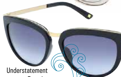
Understatement pur von Escada