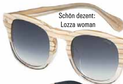
Schön dezent: Lozza woman